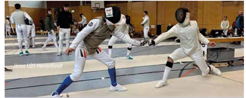
János U20 Herrenflorett