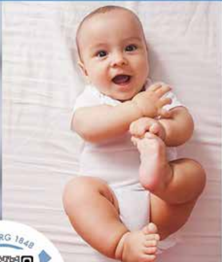
BABYS IN BEWEGUNG ab 3.-9. Lebensmonat