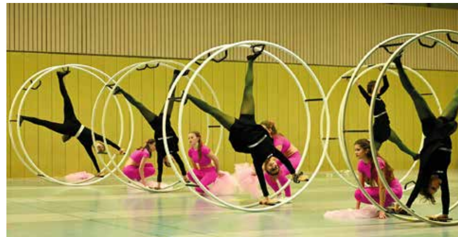
- Das Schauturnen „Wicked“