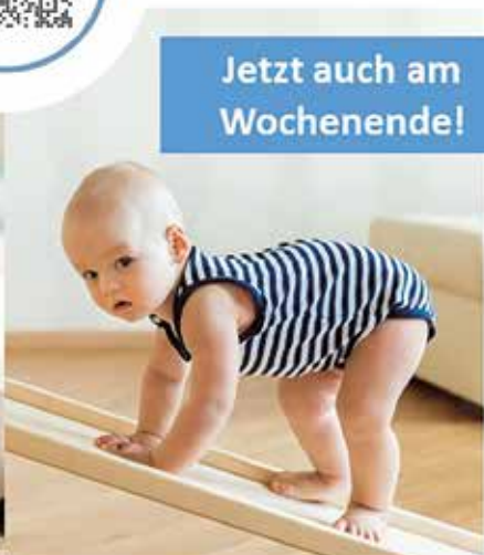
BEWEGUNGSMINIS 2 ab ca. 15 Monate