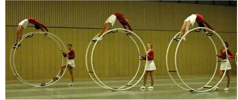
- Die Leistungsgruppe

In der nächsten Show wurde es „Weihnachtlich“: Die Wettkampfgruppe der 13-16-jährigen Turnerinnen hatte sich ein Schauturnen nach populären Weihnachts-Songs zusammengestellt. Ein großes Lob