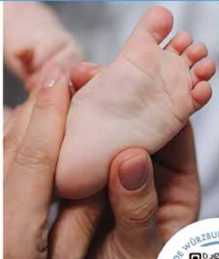
BABYMASSAGE ab 6.-14.Lebenswoche