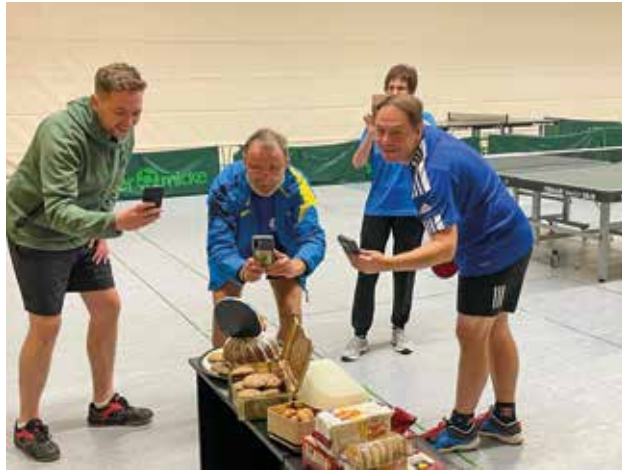
- Ein Schnapsschuss vom Glühweinturnier

Die dritte Mannschaft kämpft der Bezirksklasse D noch um den Aufstieg. Aktuell liegt das Team mit 16:8-Punkten auf Platz drei, bei Redaktionsschluss war noch alles drin!