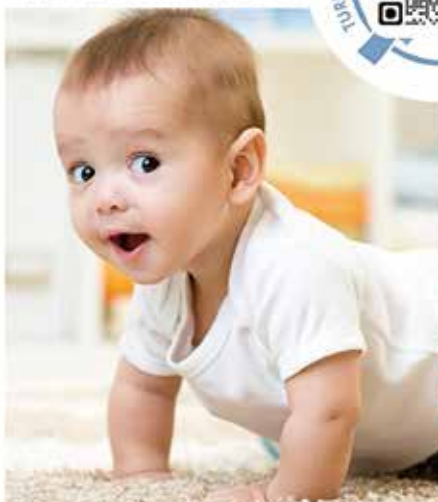
BEWEGUNGSMINIS 1 ab ca. 10 Monate