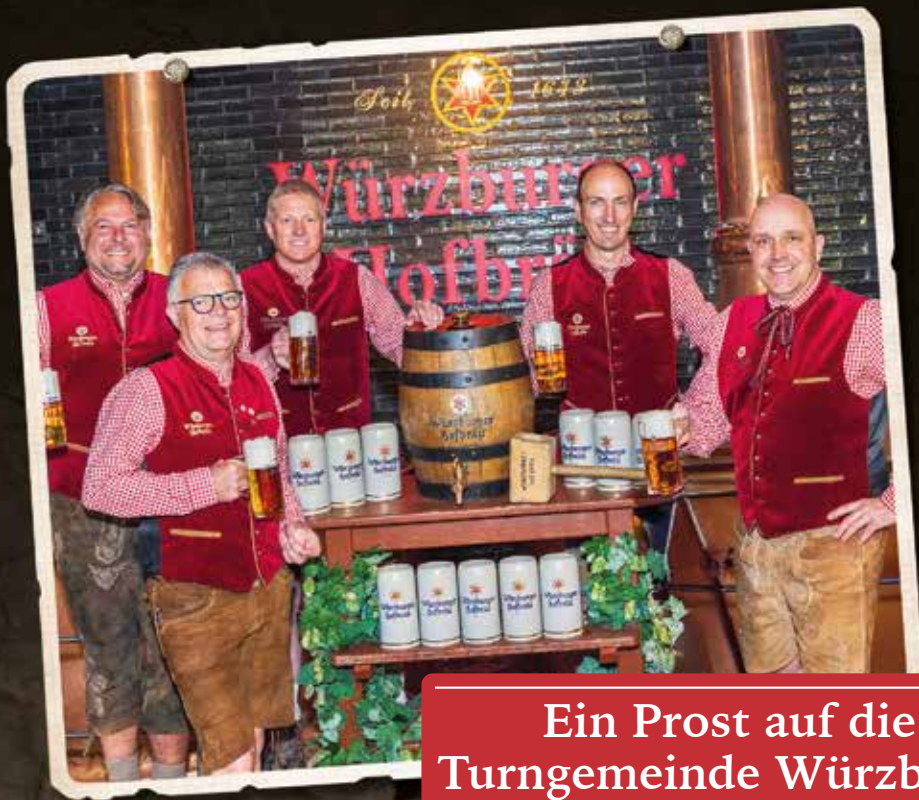
Ein Prost auf die Turngemeinde Würzburg!