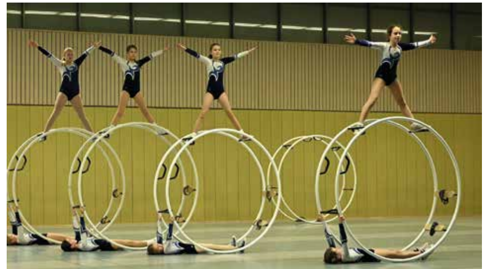
- Die Wettkampfgruppe 9-13 Jahre

für diese Gruppe, denn die Mädels hatten den größten Teil der Aufführung völlig selbständig entwickelt und eingeübt – ein echtes Highlight.